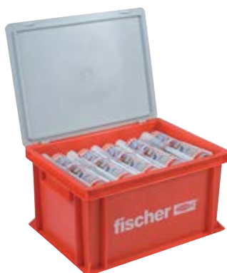
FIS V 360 S HWK большой контейнер