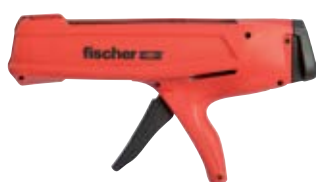
Выпрессовочный пистолет FIS DM S