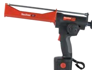
Аккумуляторный выпрессовочный пистолет FIS DC 4000 S