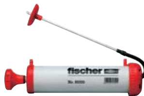
Продувочный насос ABG