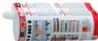
Инъекционный состав FIS V 950 S