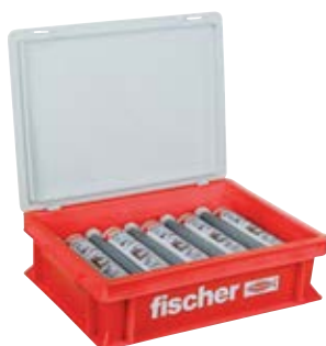
FIS V 360 S HWK малый контейнер