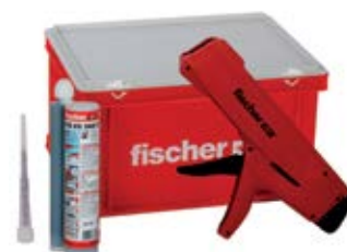
FIS V 360 S HWK большой контейнер с выpresseвочным пистолетом