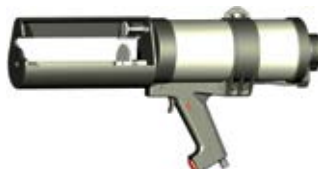
Пневматический выпрессовочный пистолет FIS AJ