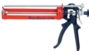
Выпрессовочный пистолет FIS AM